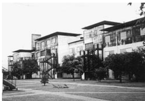
Figura 2: Tipología común de viviendas construidas en la Provincia: de financiación estatal (derecha) y privada (izquierda) Calibri 11 cursiva centrado

Se consideró la vivienda del último piso por ser la de condición más desfavorable. Teniendo en cuenta esto y las condiciones del perímetro libre de la misma, considerando las formas de agrupamiento de conjunto más desfavorables, los resultados de los análisis se pueden aplicar también para viviendas unifamiliares aisladas de una planta, con envolvente de características constructivas similares.